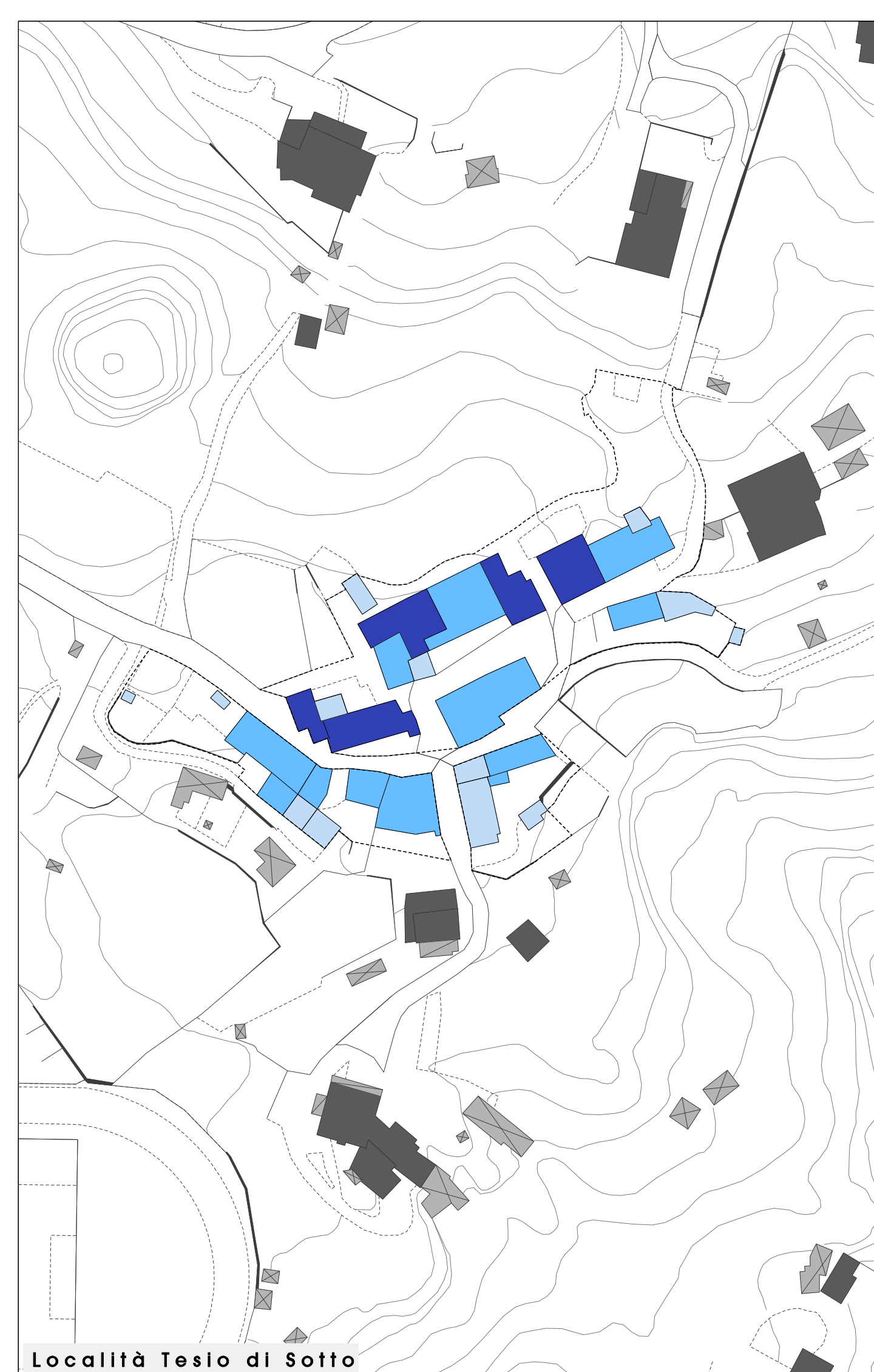
Località Teso di Sotto