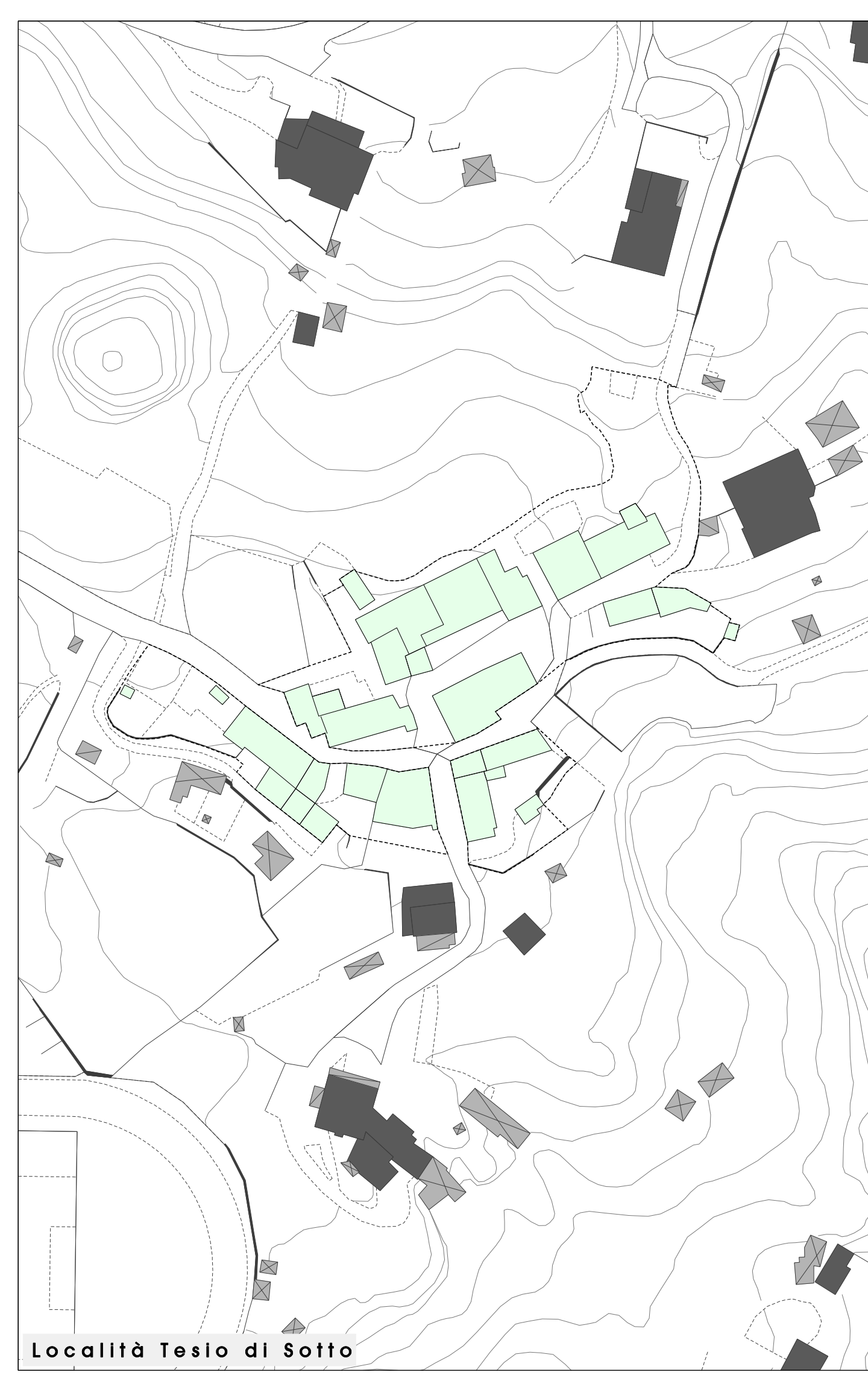
Località Teso di Sotto